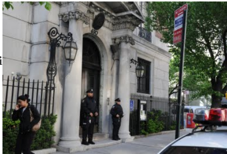
L'ingresso su Park Avenue del Consolato Generale a New York

E' passato poco più di un mese dal suo arrivo, la circoscrizione consolare a lei assegnata è complessa e vasta. Cogliamo nelle sue parole grande curiosità ma anche pazienza, desiderio di conoscere, apprendere anche passo per passo. Cominciando dai servizi consolari, quelli più tradizionali.