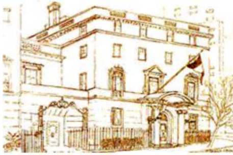
Un disegno che ritrae la palazzina del Consolato Generale a New York. Nel 1970 la Landmark Preservation Commission lo ha dichiarato edificio storico di Manhattan